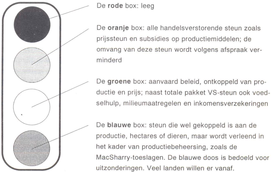
FIGUUR 2: ONDERVERDELING INTERNE LANDBOUWSTEUN NAAR WTO-BOX (VERKEERSLICHT-ANALOGIE)