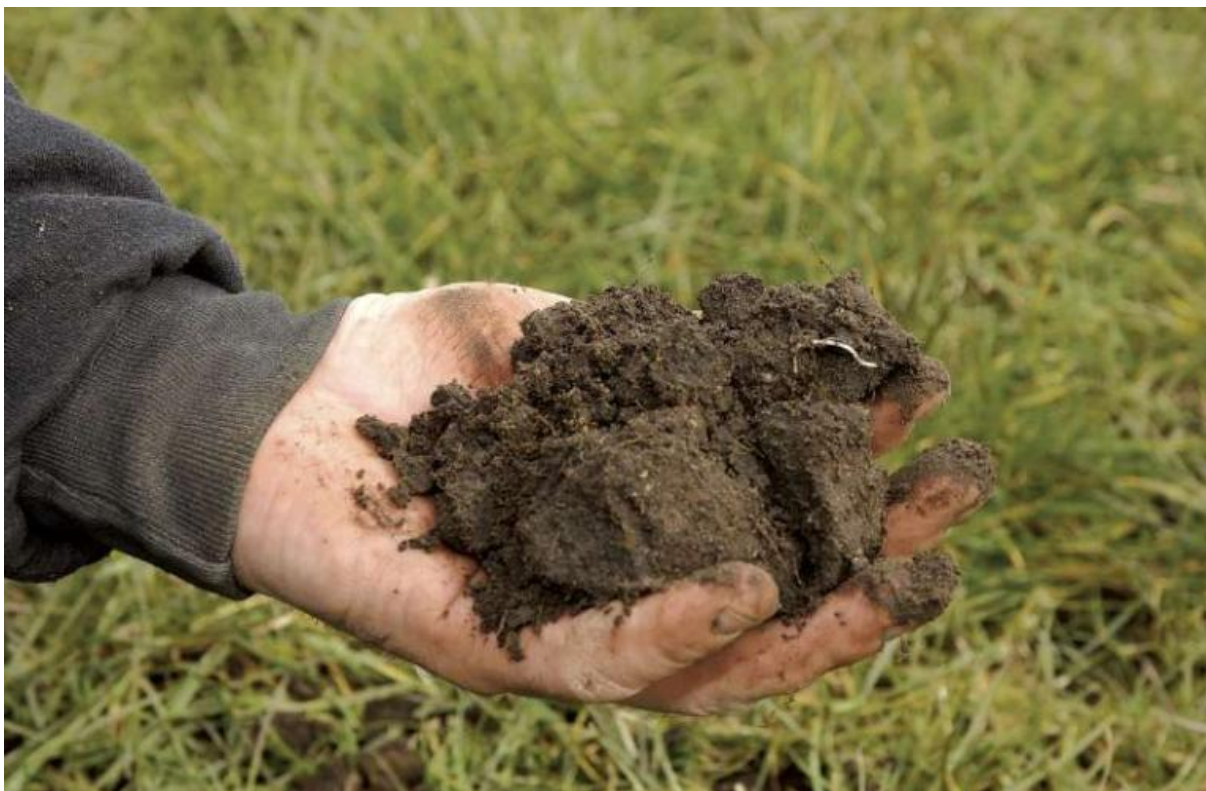
Organische stof de sleutel voor bodemvruchtbaarheid