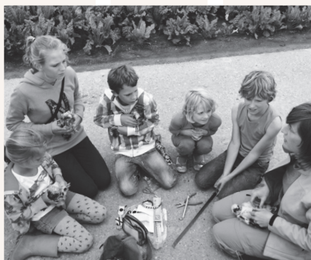
'Onze toekomst': kinderen die grauwe kiekendieven ringen zijn enthousiast over de vogels

Agro-ecologie is een methode om landbouwtechnieken en wetenschappen te gebruiken voor betere landbouw, meer biodiversiteit en als aanpak tegen klimaatopwarming en honger. Bij de technieken en wetenschappen is ook het sociaal aspect belangrijk omdat deze verbeteringen in functie staan van milieu, noord-zuidproblematiek en honger. Bron: wikipedia.